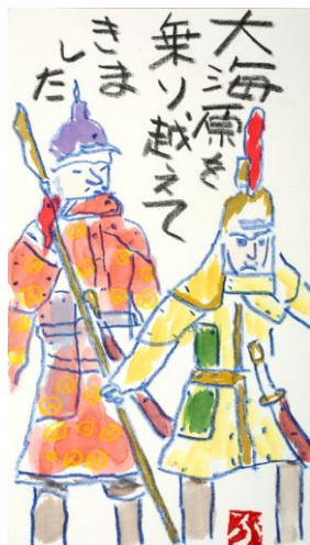
博多どんたく“山車正面飾り”